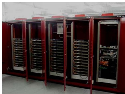
Codecs + ATM Switches

ATM Backbone: 8x ASX 1000, 1x ASX-200 von FORE Systems Ethernet interfaces: EdgeSwitches ES3810n von FORE NMS: HP Openview mit ForeView von FORE System Videocodec: Streamrunner von FORE Systems Videokompression: M-JPEG VMS: SVA (FORE) + Eigenentwicklung