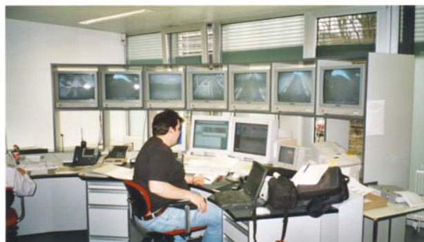
Polizeizentrale VD: Videoüberwachung, Leitsystem und Notruftelefon SOS

Schnittstellen mit anderen Kantonen: - ATM Netz Kanton Freiburg - Verkehrszähler Daten an ASTRA Funktionen: - Fernkonfiguration aller Ports - Netzverwaltungsfunktionen - Diagnostic-Funktionen - Behandlung und Analyse der Pannen jedes Moduls - Pannalarm via ULS - Videoaufschaltung via ULS