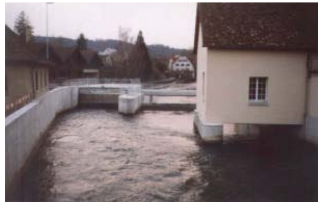
Ansicht Turbineneinlauf und Stauklappe vom Oberwasser