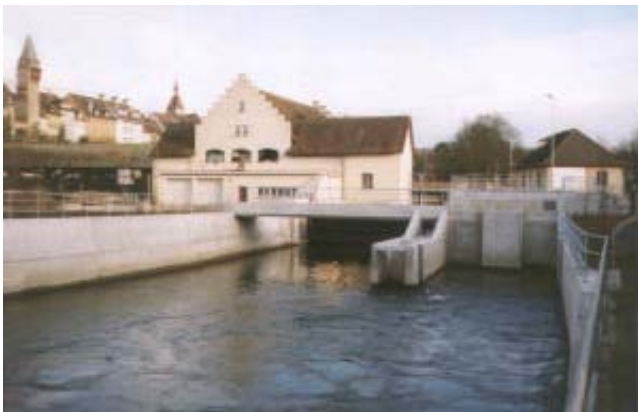
Ansicht Kraftwerksanlage vom Unterwasser

Hauptdaten: Ausbauwassermenge: 30 m 3 /s Nettogefälle: 2.22 - 1.05 m Ausbauleistung: 545 kW Turbine: Kegelarohrturbine doppelreguliert Laufrad 2600 mm/K3 Stauklappe: Breite x Höhe = 12 x 2.65 m Ableitkapazität 200 m 3 /s