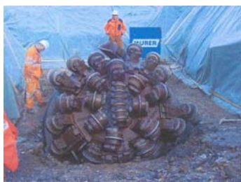
Arrivo della TBM a Bannalp