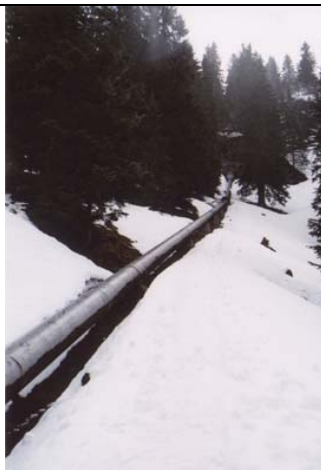
Condotta forzata esistente nel tratto all'aperto (D = 0.55 m)