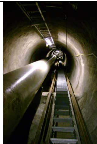
Nuova condotta forzata posata nel pozzo inclinato con elevatore