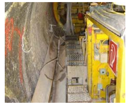
Scavo del pozzo inclinato con fresa (TBM tipo Wirth \varnothing 3.00 m con sicurezza per l'arretramento)