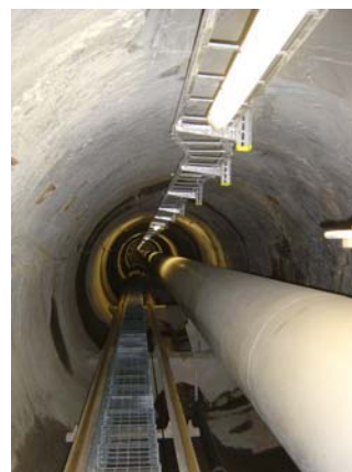
Condotta forzata montata nel pozzo inclinato con binario dell'elevatore d'ispezione