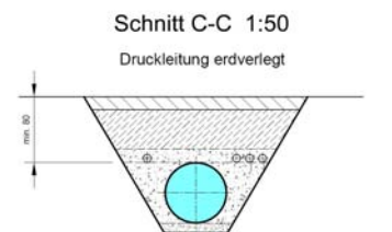
Condotta interrata nel tratto di Fellboden (D = 0.9 m)