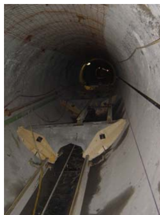
Elementi prefabbricati per la posa della condotta