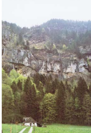
Tratto tra Bannalp e Fellboden con la condotta forzata esistente

Per il progetto e la realizzazione si è dimostrata ottimale la soluzione con pozzo inclinato diretto tra il lago di Bannalp e Fellboden con condotta appoggiata su sellette. Il pozzo inclinato è stato scavato con una fresa speciale (TBM) per pozzi inclinati di \varnothing 3.00 \text{ m} , successivamente sono stati montati elementi in beton prefabbricati per il sostegno della condotta ed infine è stata montata la condotta in acciaio. Per il montaggio e la manutenzione la condotta è affiancata da un elevatore inclinato che collega Oberrickenbach al lago di Bannalp.